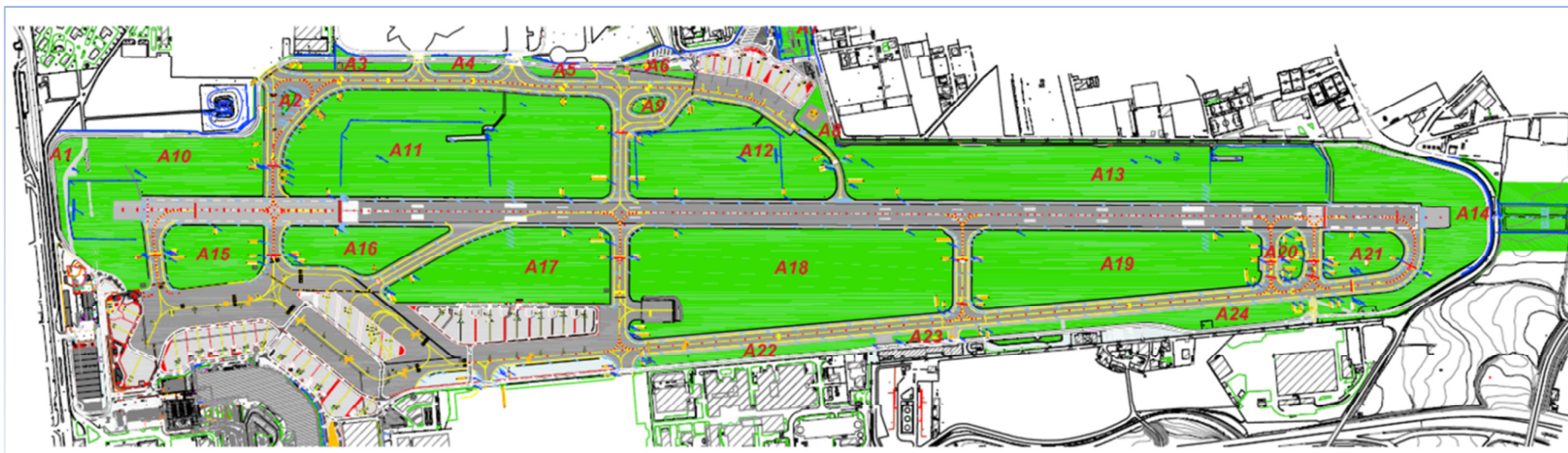
Planimetria 1 - Aree a verde ed area pavimentate